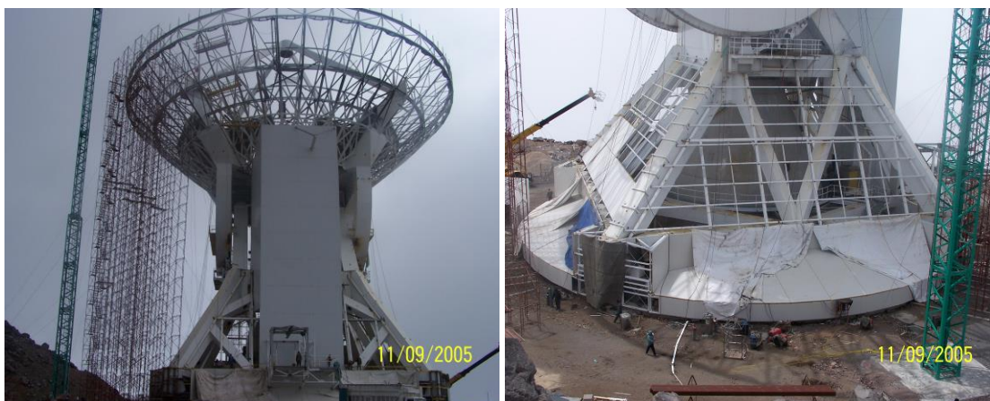
Dos vistas de los trabajos de instalación de la lámina panel que revestirá la estructura.