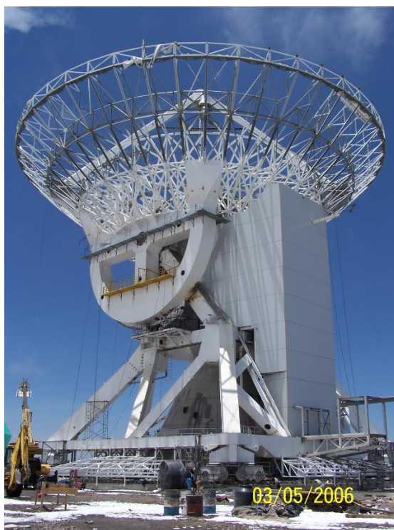
La foto muestra la estructura del GTM terminada. Se observa el edificio de los cuartos de recepción con su cubierta protectora.

Se terminó la instalación de la estructura del telescopio, lo cual implicó el montaje, alineación y soldadura de casi 2,000 toneladas de acero. Este proceso estuvo a cargo totalmente de la industria nacional, bajo una estricta supervisión de empresas internacionales expertas en la construcción de grandes antenas. Actualmente se aplica la última capa de pintura en secciones específicas y se instalan las láminas panel del revestimiento exterior de la estructura de acero ("cladding"). Asimismo, está en proceso de fabricación, en la planta de Pailería de San Luis Potosí, la cubierta deslizable ("shutter") del nivel 29.60 m.