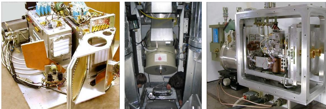
Los instrumentos iniciales del GMT: SEQUOIA, AzTECH y REDSHIFT.

Estos tres instrumentos de frontera son los dispositivos iniciales con los cuales los astrónomos de México y los Estados Unidos comenzarán a trabajar.