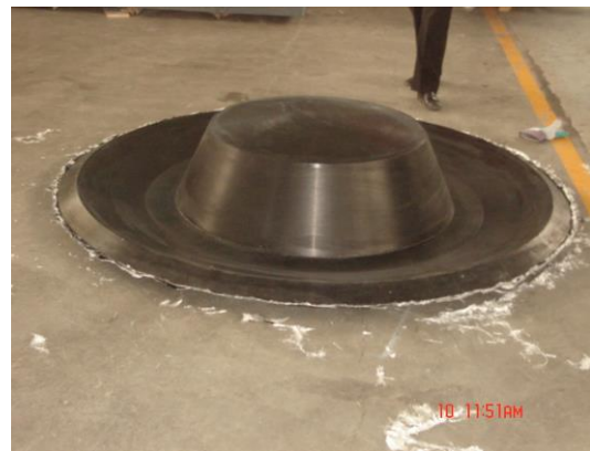
La autoclave en una nave industrial del CIATEQ, con el molde del reflector secundario en su interior. A la derecha, la membrana de soporte del espejo ya curada.