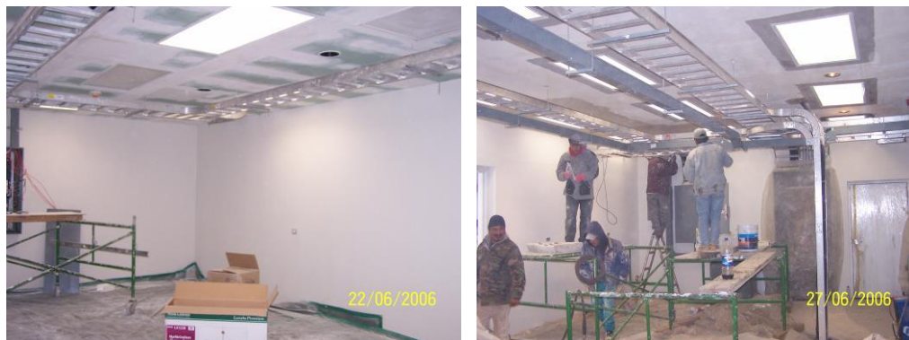
El nivel 25.80 m, en proceso de terminación.

Los acabados de los cuartos de recepción y de control (niveles 20.70 m y 25.80 m) están asimismo terminados. Actualmente se trabaja en los últimos detalles de acabado y en la terminación de las instalaciones eléctricas del nivel 29.60 m.