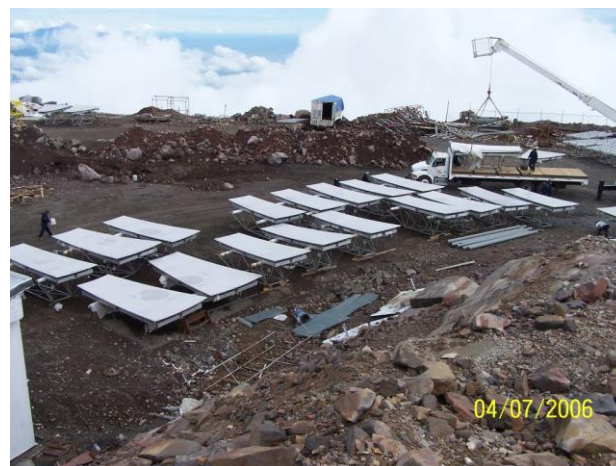
Paneles en sitio.