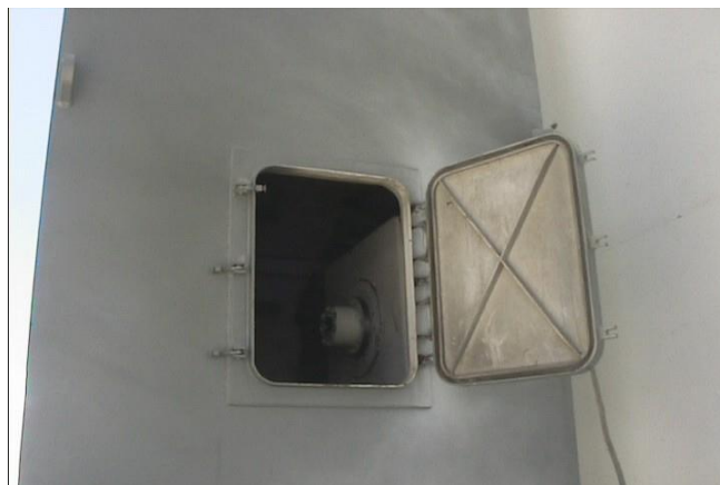
El "Stow Pin", instalado.