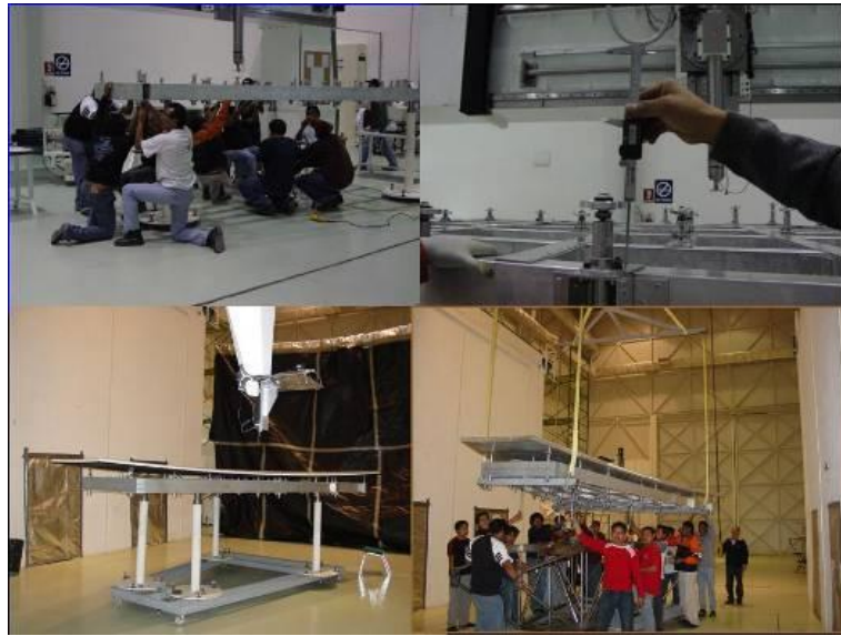
En el proceso de integración de paneles.