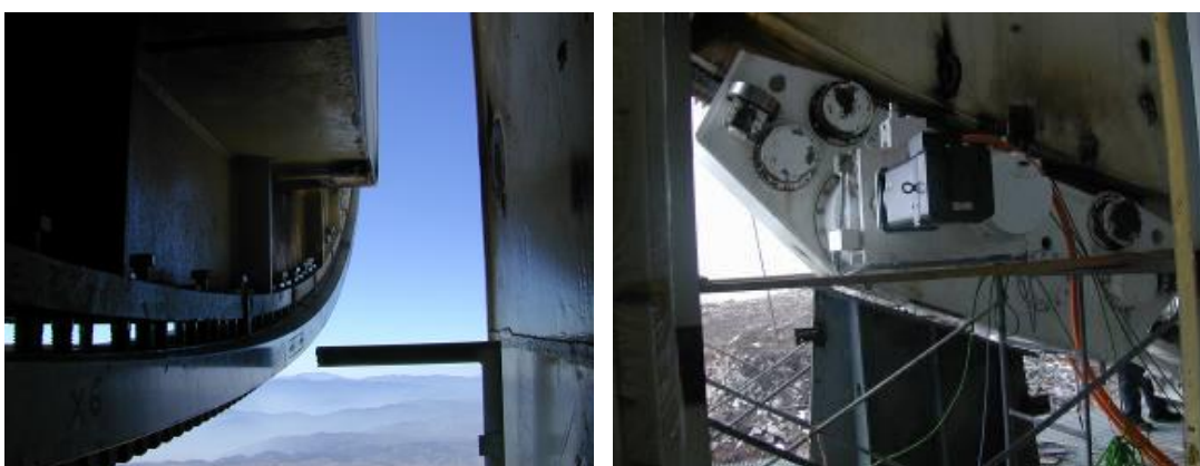
Las cremalleras y motores de elevación.

Por lo que hace al sistema de movimiento en elevación, éste se probará una vez que haya concluido la colocación de los paneles del reflector primario y se haya balanceado la antena con sus contrapesos.