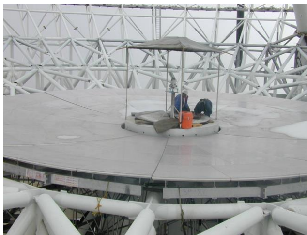
En mayo se completó la preinstalación de los paneles del anillo 1, como parte del proceso de aprendizaje del montaje definitivo.